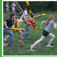
Spaß gehört zu diesem Wochenende dazu! Neben Jigger erwarten dich natürlich noch andere tolle Spiele.

„MUT tut gut“ - ist das Thema bei unserem ACTION-CAMP. Das wollen wir gemeinsam entdecken und erleben! Wir sind gespannt auf deine Mutmach-Tipps und schauen, was Menschen in der Bibel mutig gemacht hat.