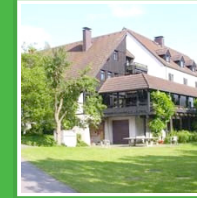
Unser Haus ist hervorragend gelegen und bietet die Möglichkeit eine Menge zu unternehmen. Langweilig wird's hier sicher nicht.

Raus aus der Schule - rein in den Spaß! Dieses Wochenende wirst du so schnell nicht vergessen. Ein abwechslungsreiches Programm mit vielen tollen Spielen erwartet dich und deine Freunde! Und zum Abschluss des Tages wird abends gemeinsam ein Lagerfeuer gemacht.