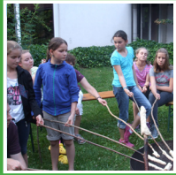
Gemeinsam bereiten wir unser eigenes Stockbrot zu und lassen es über dem Lagerfeuer knusprig braun werden.

„MUT tut gut“ - ist das Thema bei unserem ACTION-CAMP. Das wollen wir gemeinsam entdecken und erleben! Wir sind gespannt auf deine Mutmach-Tipps und schauen, was Menschen in der Bibel mutig gemacht hat.